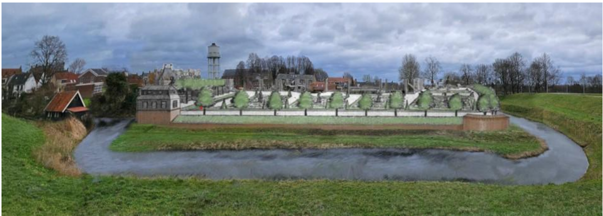
Ingekleurde fotomontage van het kasteel met de tuin vanaf de Lekdijk, HvBV 2024.

Naast de leerdoelen voor praktijkgericht onderwijs willen we het ambachtelijke maakproces als beleving voor geïnteresseerden uitzetten. Het proces is dus zeker net zo bijzonder als het resultaat. Vandaar dat we voor de uitvoering de tijd nemen en het kleinschalig uitvoeren, zodat zoveel mogelijk mensen in het proces kunnen participeren.