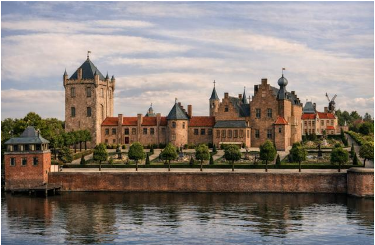
Digitale AI bewerking van het kasteel met de historische tuinaanleg op basis van de ets van Caspar Specht uit circa 1700, HvBV 2026.

Rond 1630 laat hij het L-vormige terrein in de noordwesthoek, ingesloten tussen het kasteel en een verhoogde dijk met slotgracht omtoveren tot een verdiepte parterretuin. Het ontwerp komt van de Fransman Isaac Leschevin . Vijf grote plantvakken, strak geknipte hagen en sierlijke latwerkconstructies maken van deze tuin een indrukwekkend, baanbrekend en toonaangevend ontwerp dat nog lang van invloed zal blijven.